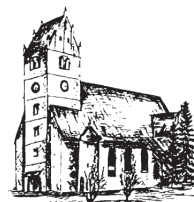
St. Cornelius u. Cyprian